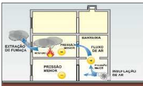
Figura 3 - Diferencial de pressão

c. permitir um diferencial de pressão, por meio do controle das aberturas de extração de fumaça da zona sinistrada, e fechamento das aberturas de extração de fumaça das demais áreas adjacentes à zona sinistrada, conduzindo a fumaça para as saídas externas ao edifício (ver Figura 3).