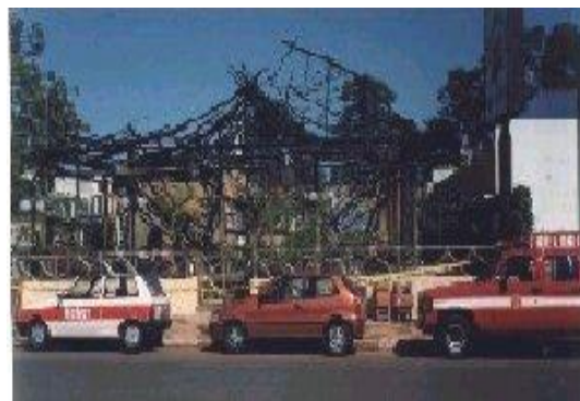
Figura 2 - Incêndio em edificação com cobertura de fibras vegetais (ocupação de bar e restaurante).

5.5.4 Recomenda-se a utilização de sistemas de aspersão de água que visam a manter as fibras permanentemente úmidas ou destinadas ao próprio combate das chamas, sem prejuízo das demais medidas constantes desta NT.