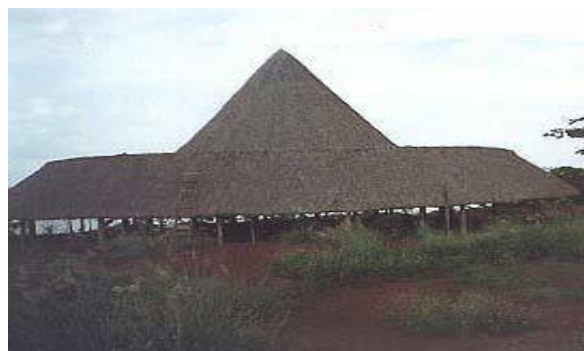
Figura 1 - Edificação de madeira com cobertura de fibras vegetais

5.1.3 A fiação que não estiver embutida em alvenaria ou concreto deve estar totalmente protegida por eletrodutos metálicos.